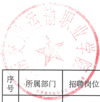
附件1：云南交通运输职业学院2020年第五批编制外教师招聘计划表